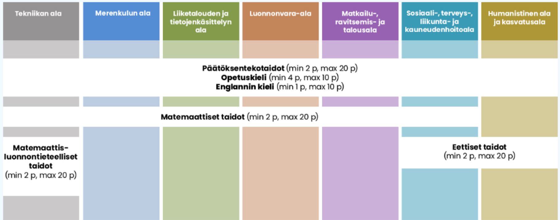
Kuvio 1. AMK-valintakokeen osiot koulutusaloittain sekä osioiden alimmat hyväksytyt pistemäärät ja maksimipisteet kevään 2020 toisessa yhteishaussa.